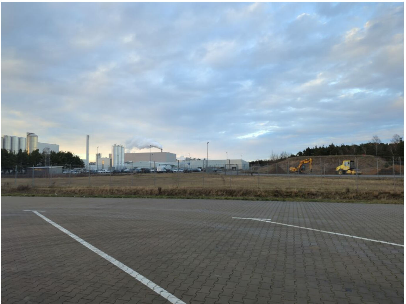
La fabbrica Brandenburger Urstromquelle imbottiglia acqua minerale a Baruth dagli anni Novanta. Nel 2023 è stata venduta a Red Bull e Rauch, il più grande imbottigliatore di Red Bull.

Questa crisi non può essere risolta solo dai cittadini. Anche se la direttiva quadro sulle acque dell'Unione europea fornisce un'importante base giuridica e ha portato a progressi significativi nella gestione delle risorse idriche, i dati emersi dal monitoraggio suggeriscono che i suoi obiettivi non saranno raggiunti entro la scadenza del 2027.