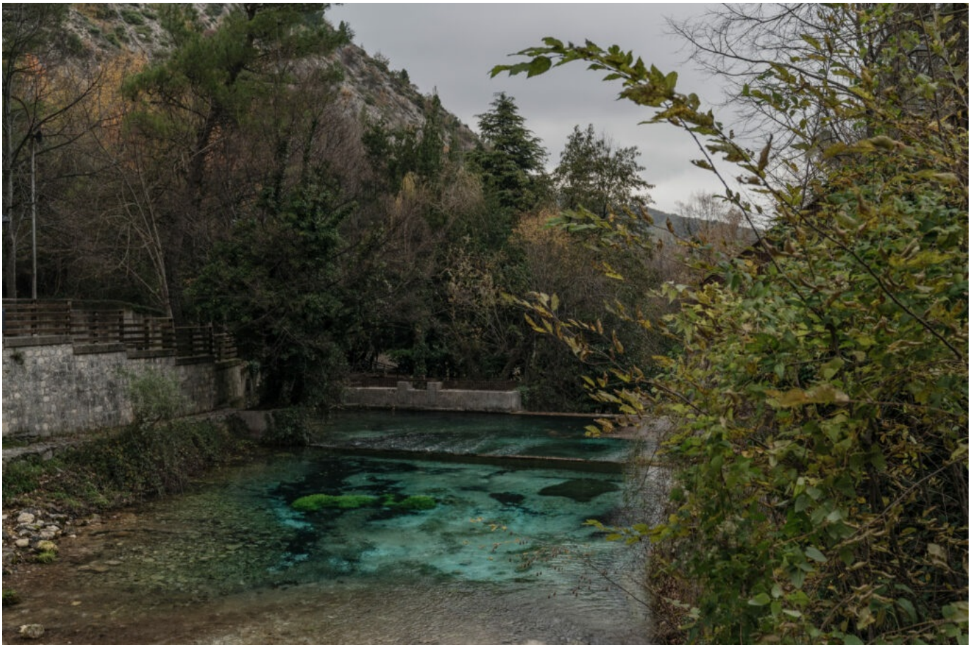
La sorgente Verde dove nasce, a Fara San Martino, provincia di Chieti, Italia.