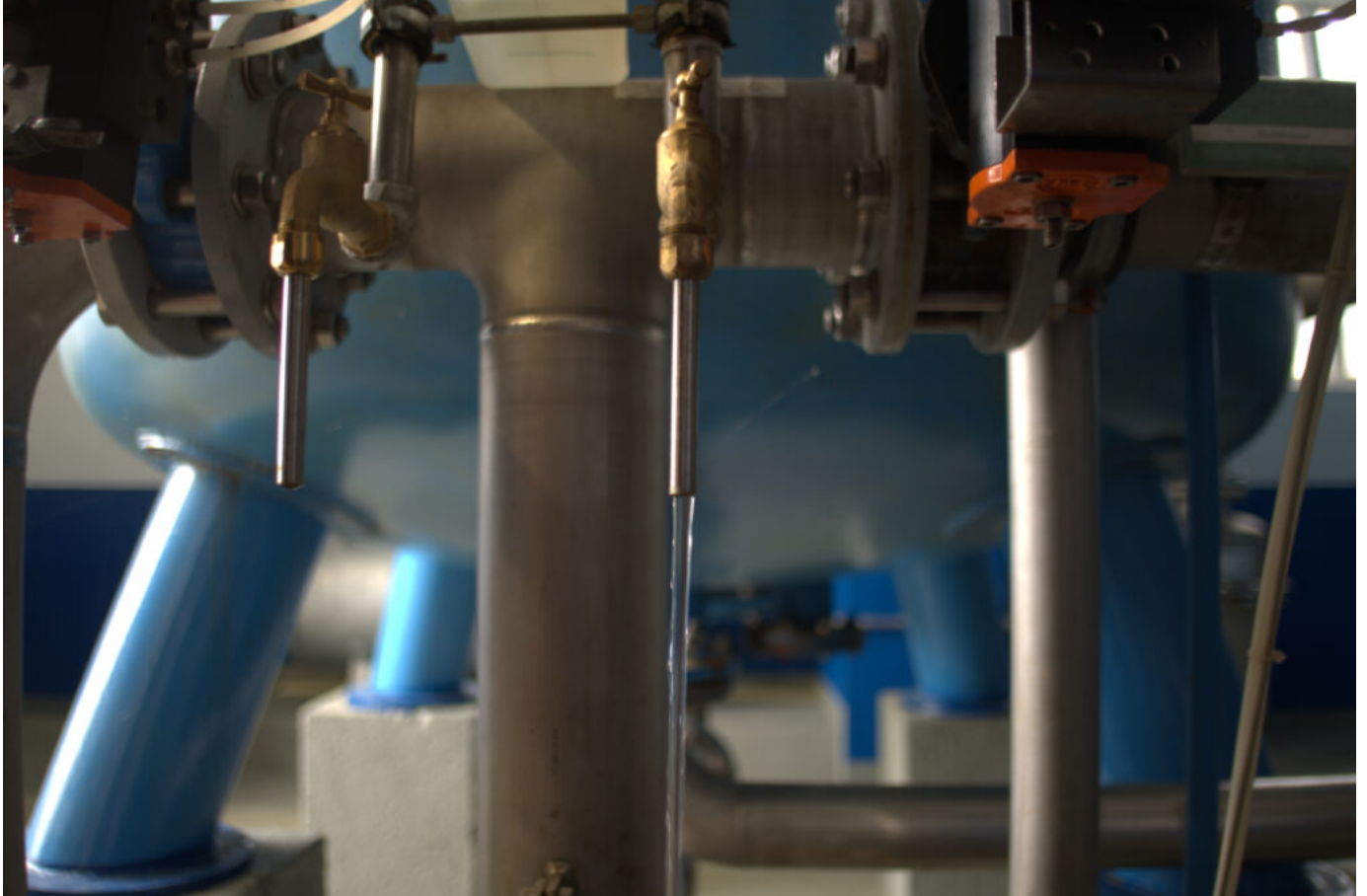
Il fornitore di acqua di Baruth, Wabau, estrae il 100 per cento dell'acqua potabile della città dalle falde acquifere sotterranee.

Nel frattempo, il Brandeburgo diventa sempre più arido. La falda freatica sprofonda e gli incendi sono più frequenti, aumentando il consumo di acqua.